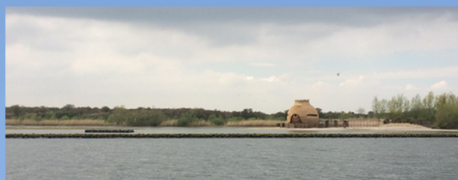
'Sterre' broedvogeleiland® Scheelhoek bij het Tij

Het succes van de broedvogeleilanden smaakt naar meer. De modulaire opbouw van het 'Sterre' broedvogeleiland® maakt het mogelijk om op een simpele wijze elders in het Deltagebied, maar zeker ook daarbuiten, extra geschikt broedbiotoop voor de visdief te creëren. Het ontwerp staat vast, alleen de oppervlakte en de verankering dienen bepaald te worden. Dit maakt dat snel een eiland gerealiseerd kan worden.