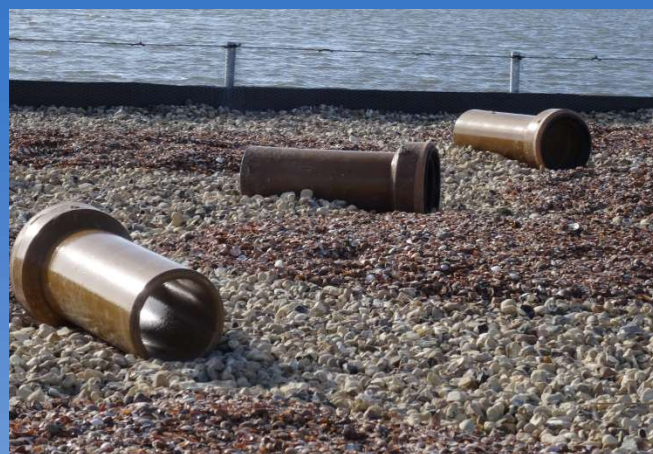
Rioolbuizen bieden bescherming voor de jonge vogels

Het Kustbroedvogelfonds bemiddelt in de levering van het 'Sterre' broedvogeleiland® tussen initiatiefnemer en Nauticparts, die niet alleen de kunststofelementen levert, maar ook zorg draagt voor de montage ter plaatse en de complete inrichting. De globale kosten van het eiland bedragen van € 300,- tot € 350,-/m 2 , afhankelijk van de oppervlakte, de locatie waar het eiland komt en de mogelijkheden voor de verankering. Voor de bemiddeling vraagt het Kustbroedvogelfonds een donatie van de initiatiefnemer.