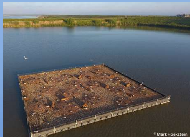
'Sterre' broedvogeleiland® Inlaag Oesterput

Het Kustbroedvogelfonds bemiddelt in de levering van het 'Sterre' broedvogeleiland® tussen initiatiefnemer en Nauticparts, die niet alleen de kunststofelementen levert, maar ook zorg draagt voor de montage ter plaatse en de complete inrichting. De globale kosten van het eiland bedragen van € 300,- tot € 350,-/m 2 , afhankelijk van de oppervlakte, de locatie waar het eiland komt en de mogelijkheden voor de verankering. Voor de bemiddeling vraagt het Kustbroedvogelfonds een donatie van de initiatiefnemer.