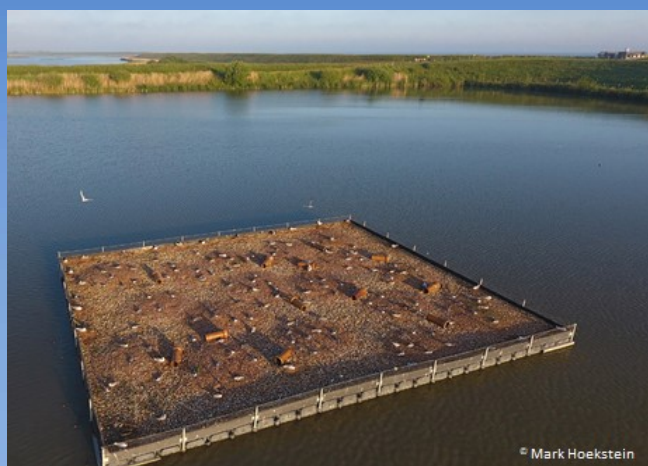
'Sterre' broedvogeleiland ® Inlaag Oesterput

Het ontwerp staat vast, alleen de oppervlakte en de verankering dienen bepaald te worden. Dit maakt dat snel een eiland gerealiseerd kan worden.