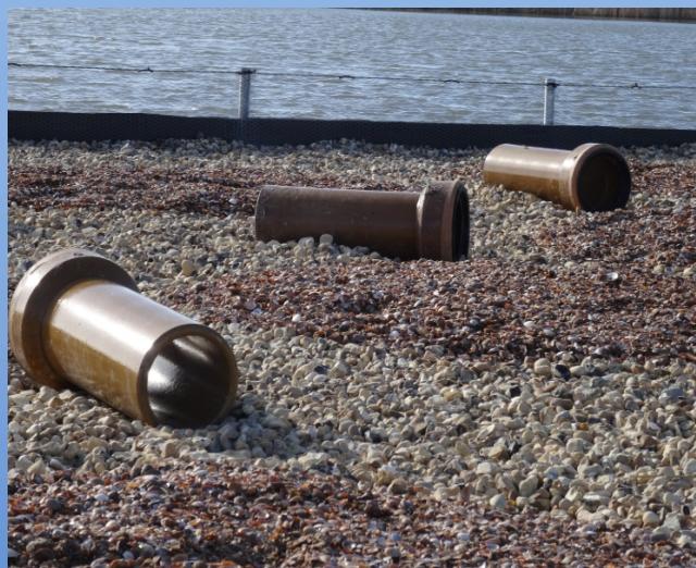
Rioolbuizen bieden bescherming voor de jonge vogels

Het Kustbroedvogelfonds bemiddelt in de levering van het 'Sterre' broedvogeleiland ® tussen initiatiefnemer en Nauticparts, die niet alleen de kunststofelementen levert, maar ook zorg draagt voor de montage ter plaatse en de complete inrichting. Het Kustbroedvogelfonds kan ook een directe financiële bijdrage leveren of in de vorm van voorfinanciering. De globale kosten van het eiland bedragen van € 300,- tot € 350,-/m 2 , afhankelijk van de oppervlakte, de locatie waar het eiland komt en de mogelijkheden voor de verankering. Voor de bemiddeling vraagt het Kustbroedvogelfonds een donatie van de initiatiefnemer.